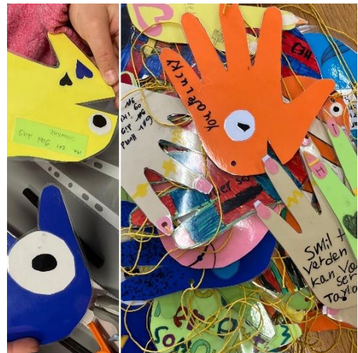
Highfive-fisk på Munkholmskolen