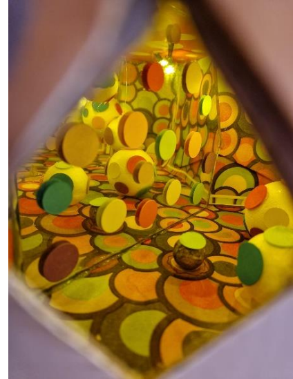
Kusama-prikker på Lyngby Friskole

På Lyngby Friskole fordybede eleverne fra 0.-8. kl. sig i Yayoi Kusamas prikkede univers hele dagen, mens eleverne på Trekløverskolen ved Silkeborg lavede lys-malerier à la Asger Jorn. Stenløse Privatskole helligede sig Picasso i anledning af dagen, og alle elever fra 1-8. klasse arbejdede inspireret af kunstneren. Det var 5. år i træk, at skolen fejrede Billedkunstens Dag med en stor udstilling, og heldigvis er der flere og flere skoler – og andre institutioner – der skriver Billedkunstens Dag ind i deres årshjul.