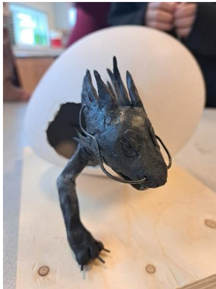
Drageæg på Hørve Skole