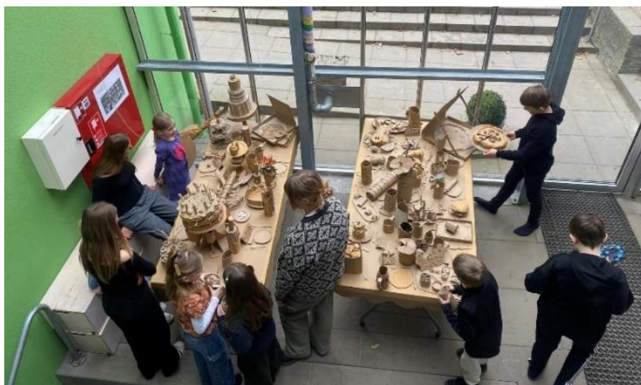
Også Randers Lille Skole fejrede Billedkunstens Dag med en fælles papinstallation: "Gå papamok til det store festbord". Der blev arbejdet hele dagen på tværs af klasser og årgange.