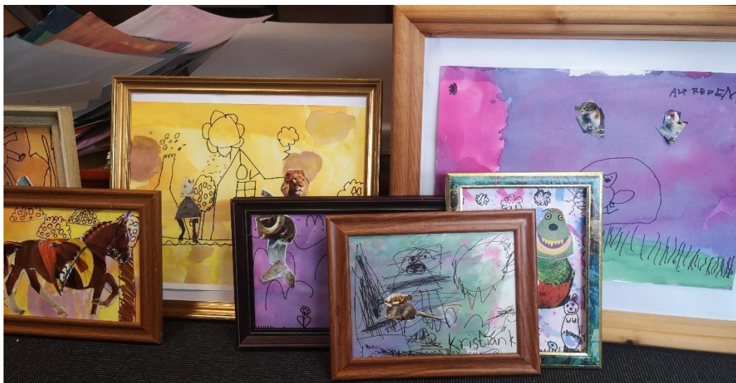
Fabelagtige Fabeldyr på Museum Salling. Alle børn måtte vælge en doneret genbrugsramme til deres billede.

Årets udgave af Billedkunstens Dag var ligesom tidligere år præget af store samarbejdsprojekter. Begivenheden var et vigtigt omdrejningspunkt for et stort samarbejdsprojekt i regi af kulturaftalen for Midt- og Vestjylland. Her blev der arbejdet med mange forskellige former for "Fabelagtige Fabeldyr" i bl.a. Museum Salling, Skive Musikskole, Skive Bibliotek, Hem Skole, Brande Kunstskele, Geopark Vestjylland, Varde Musik- og Billedskole og CHPEA-museum.