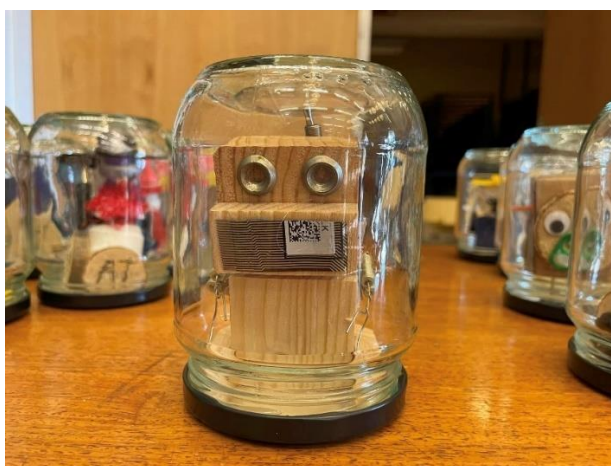
"Råsyttede robotter" på Holbergskolen

Billedpædagogisk Tidsskrift nr. 2, 2024 indeholder en omtale af fire skolars aktiviteter ifm. Billedkunstens Dag.