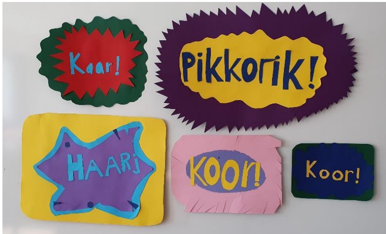
Folkeskolen Tasersuup Atuarfia i Qaqortoq, Grønland