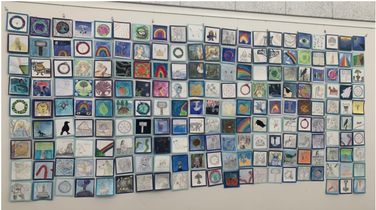
Fællesværk om nordisk mytologi v. Billedkunstaffdelingen på Skanderborg Kulturskole