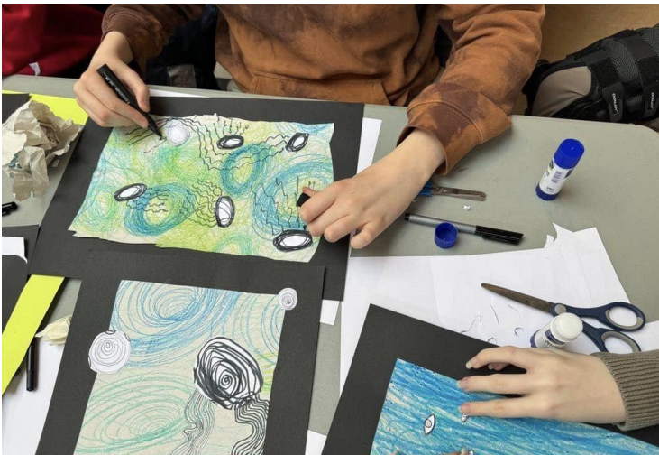
Små og store bevægelser på Skrillingeskolen

Inspirationskatalogerne til Billedkunstens Dag og de tidligere 'udgaver' af dagen kan betragtes som én stor pulje af gode idéer, som man kan bruge løs af, og det er der heldigvis mange, der benytter sig af. Et par eksempler er Skrillingeskolen i Middelfart, der arbejdede med "Små og store bevægelser" fra inspirationshæftet fra 2023, og Munkholmskolen i Stevnstrup, som havde fokus på "synlighed" og hængte en masse highfive-fisk – årets katalog-hit i 2018 – op i byen med søde hilsner og budskaber.