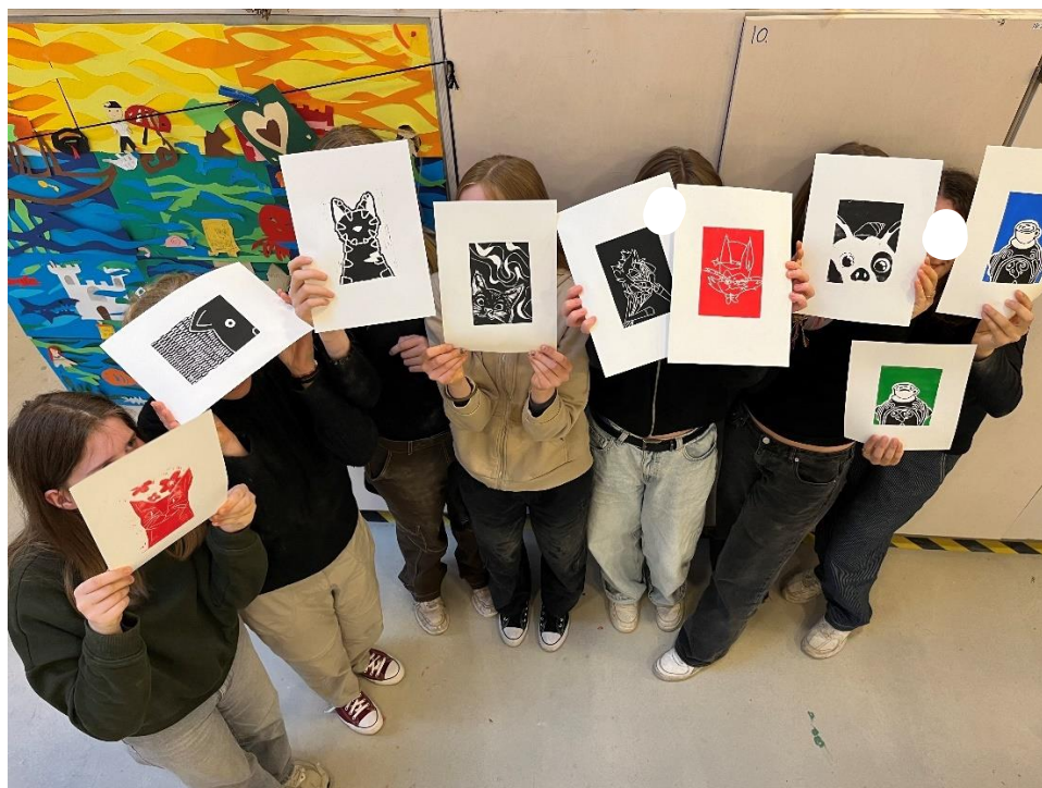
Kulturskolen Roskilde: "Som hund og kat"-tryk – med papirklip i baggrunden

Idéen "Som hund og kat" stammer fra Herning Billedskole, som også sørgede for, at der – blandt meget andet – blev eksperimenteret med hunde- og kattetryk på Snebjerg Skole. Mellemtrinnet på Hørve Skole udklækkede drageæg i stor stil, og på Nydamskolen lavede nogle af de yngre børn med udgangspunkt i inspirationskataloget og et tema om "Superhelte" deres egne penselhelte af brugte pensler. Med afsæt i idéen "At bo i en sko" blev brugte sko omdannet til mikrohjem på Uldum Skole.