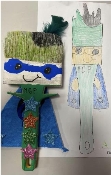
Penselhelte på Nydamskolen