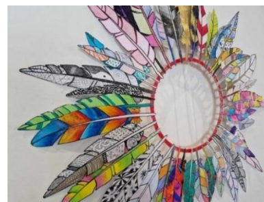
Tre x fjer: Grunnskóli Borgarfjarðar, Fellaskóli og gymnasieskolen Menntaskólinn

I Norge blev der bl.a. bygget en pap-by på Skattebøl Skole i Ål ved Geilo, mens foreningen Kunst i Skolen afholdt et åbent webinar med udgangspunkt i deres bidrag til årets inspirationskatalog til Billedkunstens Dag, "Ta i bruk den nære kunsten!". Webinaret blev optaget og kommer til at ligge på bl.a. Kunst i Skolens hjemmeside til fri afbenyttelse.