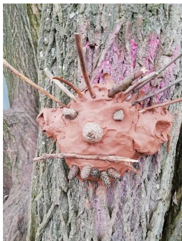
Sdr. Jernløse Lilleskole

På Billedkunstens Dag 2024 var der også digitale billeder skabt af elever fra fritidshold og kulturklasser på Den Kreative Skole i Silkeborg. Der var udendørs ler-trætrolde på Sdr. Jernløse Lilleskole og lerhunde med øjne så store som tekopper på Trekronerskolen i Nordjylland. Der var strikdyr fra Det Kreative Værksted i Malling, tekstilskulpturer inspireret af Shanes univers på Gilbjergskolen Blistrup – og Holbergskolens 700 "Råsyttede Robotter i Holmegårdsglas". Og meget, meget mere.