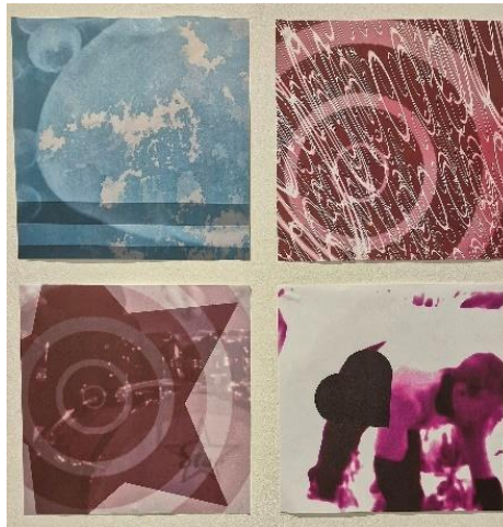
Den Kreative Skole i Silkeborg

Fra Kompetencecenter for børn, unge og billedkunst og Danmarks Billedkunstlæreres side kan vi kun opfordre til, at man bruger tiden frem mod næste Billedkunstens Dag til at gå på eventyr i Facebook-gruppen Billedkunstens Dag, i #billedkunstensdag på Instagram og i alle inspirationskatalogerne.