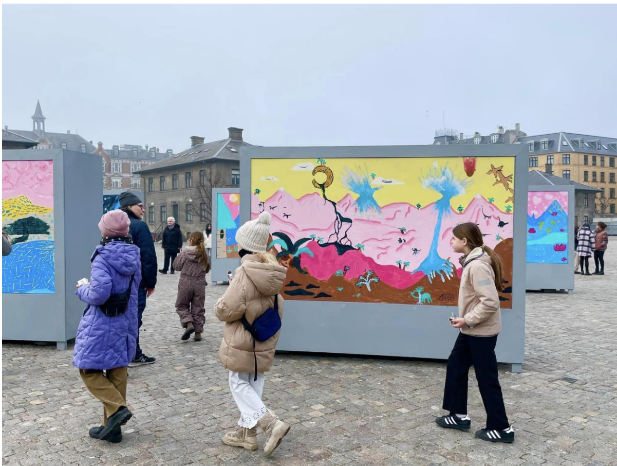
Landskabsstafet v. Billedskolen Tvillingehallen